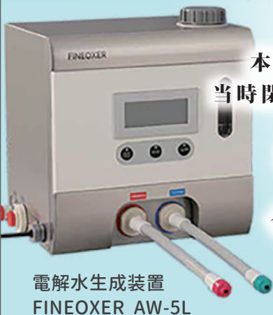
電解水生成装置 FINEOXER AW-5L